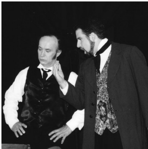
La pièce Les Justes présentée en 2022