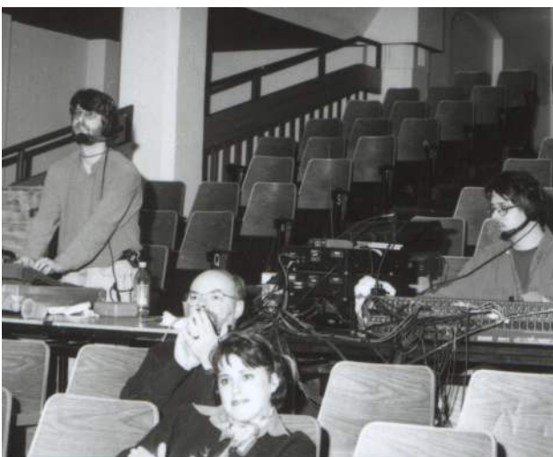
L'envers technique d'une pièce

Avant chaque représentation, je me demandais toujours pourquoi je m'étais embarquée dans un