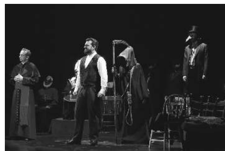
La dernière nuit de Louis Riel

Et finalement, ma dernière aventure avec Montserrat remonte à 2017 avec le titanesque projet de La dernière nuit de Louis Riel un texte solide