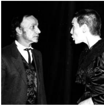
Les personnages de Stepan et Dora dans la pièce Les Justes