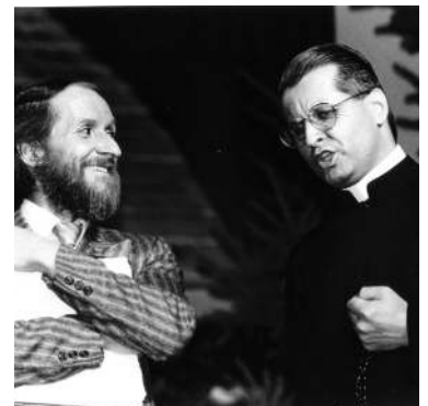
Les Grands d'ici , pièce écrite par Gilles Ouimet, 1985 Crédit : Troupe Montserrat

Et ça advient. Il a fallu d'abord choisir qui représenter. Pas évident. Au début, un choix à faire. Faut-il opter pour des personnes décédées, vivantes ou encore un mélange des deux? J'ai choisi. Trouvant un peu risqué et compliqué de mettre sur scène des