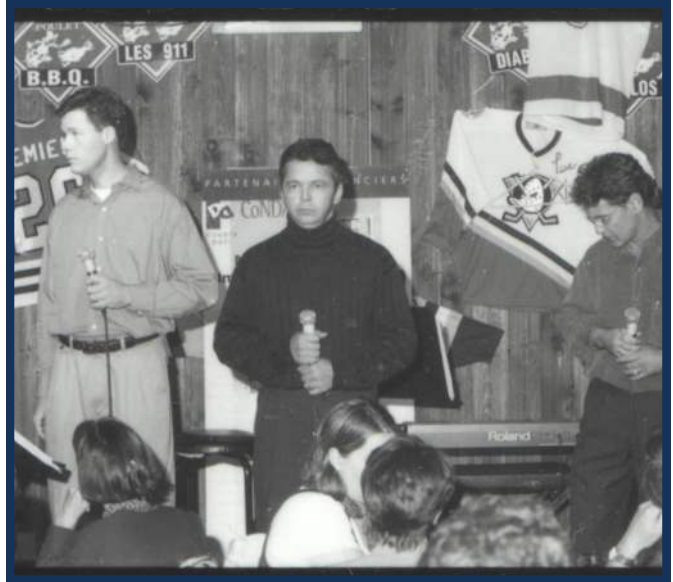
Fonds Gilles Boyer P176-Feuilles-P015

Auteure, comédienne, amoureuse du théâtre