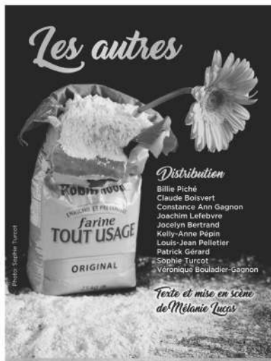
Les autres, une pièce de Mélanie Lucas présentée en 2019

j'extrais, je m'extirpe, je m'arrache les mots du plus creux de mon ventre pour témoigner de ce monde qui est le mien, le théâtre.