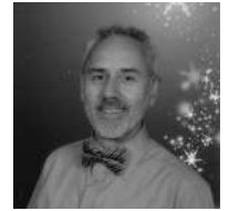
Par Pierre Dionne

L a troupe de théâtre Montserrat a toujours maintenu au fil des années le désir de faire connaître aux spectateurs de grands auteurs de par la musicalité de leurs textes, de par la richesse de leur discours et du propos brillamment mis en paroles et en silences.