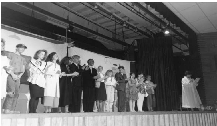
Fin d'une pièce de Montserrat

Comédien, metteur en scène, animateur et également administrateur à la Fédération québécoise du théâtre amateur