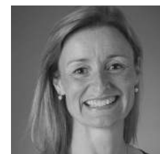
Par Mariève Croteau

J ouer au théâtre, c'est magique! On rentre dans la peau de quelqu'un d'autre. On emprunte des mots qui ne viennent pas de nous. On fait rire, pleurer, rêver ou réfléchir les spectateurs. Jouer au théâtre, c'est vivre de nombreuses émotions et passer par plusieurs états allant du stress à la joie. Jouer au théâtre, c'est recevoir des encouragements et des félicitations du public, mais c'est aussi beaucoup de travail!