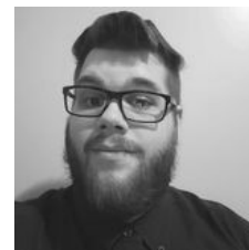
Par Yohan Desmarais

L'histoire, c'est quoi? On serait tenté de dire le passé, mais la réalité est plus nuancée que cela. Le mot « histoire » vient du grec ancien « historia » qui signifie « enquête ». En cela, l'histoire ne désigne pas tant le passé que l'enquête que l'on fait sur celui-ci. Plus précisément, l'histoire est un récit. Le passé n'est que son sujet. Le travail de l'historien consiste à produire un récit véridique. En cela, l'histoire est une discipline intellectuelle, considérée depuis quelques décennies comme une science sociale en part entière, qui s'accompagne d'une méthodologie établie par des générations d'historiens et d'historiennes qui ont peu à peu raffiné la méthode. Car le but des historiens reste de produire une connaissance objective. Autrement dit, que l'histoire fantasmée, le récit historique, soit le plus près possible du passé réel.