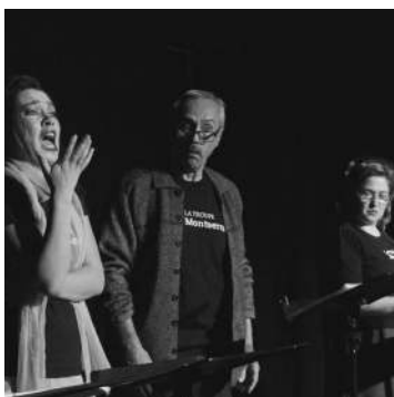
Les Grands départs, une lecture publique théâtralisée, 2017

Un jour, Gilles Ouimet me propose de jouer 2 textes d'Anton Tchekhov auteur russe de très grand talent dont les classiques sont joués chaque année par les maisons de production montréalaise dans de grandes salles. Cependant, Montserrat opte pour Les fantaisies de Tchekhov , c'est à dire 4 petites parodies, satires sociales, farces ou abîmes psychiques. J'hésite .... avec appréhension ....peut-être par crainte de ne pouvoir me mettre les mots de Tchekhov en bouche, on parle ici de Tchekhov, talentueux auteur que tout comédien doit apprivoiser pour s'attaquer à des personnages « confrontés à la sclérose des habitudes et à l'usure du temps que rien ne résiste ». Mais quelle découverte, quelle force, une puissance dans la prose, dans le rythme bien balancé, la complainte et la montée dramatique derrière un texte cadencé, articulé et déclamé avec une grande aisance.... Quel heureux souvenir!