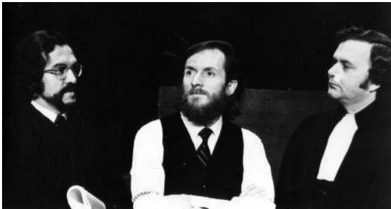
La pièce Sacco et Vanzetti , 1973

J'ai assisté aux débuts de la troupe Montserrat, qui avant son incorporation en 1977, portait le nom de « Troupe de théâtre des professeurs ». Pendant toute la première décennie, mon rôle s'est limité à celui de spectateur même si quelqu'un était venu, un jour, déposer un texte sur mon bureau pour un rôle dans une production. Je ne me souviens plus vraiment laquelle cependant. Peut-être Sacco et Vanzetti . N'ayant jamais fait de théâtre de ma vie et étant très impliqué dans le hockey mineur à l'époque, j'avais alors décliné cette invitation au théâtre. Je ne me doutais pas alors que les circonstances allaient m'y ramener plus tard mais par une autre avenue.