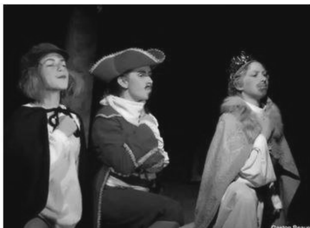
À la recherche du dragon d'Achlésor présenté par Montserrat junior

C'est lorsqu'on goûte pour la première fois au théâtre qu'on n'a plus jamais envie de le quitter. Lorsqu'on découvre son univers, sa scène, ses magnifiques costumes, ses répétitions, ses spectateurs. Lorsqu'on lui dédie tout son temps et sa passion pour faire vivre aux autres tant d'émotions.