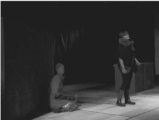
Scène de la pièce Les autres de Mélanie Lucas

prise créée, le déclenchement de quelque chose, la mutation d'un rien en tout. On fait du théâtre pour la réception d'émotions avec de grandes lettres. On fait du théâtre pour voir se créer ce changement qui nous dépasse grâce à l'engouement et la détermination des artistes de région. Celui d'une communauté qui se surprend elle-même à s'unir autour d'événements culturels, autour de projets artistiques innovateurs. Oui, effectivement, oui, je le répète, nos communautés sont souvent plus curieuses qu'on ose le croire.