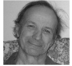
Par Gilles Ouimet

J'ai assisté aux débuts de la troupe Montserrat, qui avant son incorporation en 1977, portait le nom de « Troupe de théâtre des professeurs ». Pendant toute la première décennie, mon rôle s'est limité à celui de spectateur même si quelqu'un était venu, un jour, déposer un texte sur mon bureau pour un rôle dans une production. Je ne me souviens plus vraiment laquelle cependant. Peut-être Sacco et Vanzetti . N'ayant jamais fait de théâtre de ma vie et étant très impliqué dans le hockey mineur à l'époque, j'avais alors décliné cette invitation au théâtre. Je ne me doutais pas alors que les circonstances allaient m'y ramener plus tard mais par une autre avenue.