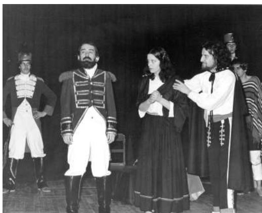
La pièce Montserrat, la première jouée par la troupe

exemplaire à la sémantique du projet. Entouré de comédiens et comédiennes de grand talent, je me souviens qu'il était minuit moins cinq avant que la « retenue » tombe, que la pudeur du « lâcher prise » lâche et que l'abnégation de soi