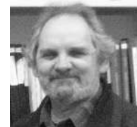
Par Benoît Legault