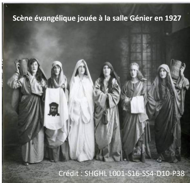
Scène évangélique jouée à la salle Génier en 1927

Elle a participé à plusieurs festivals de théâtre.