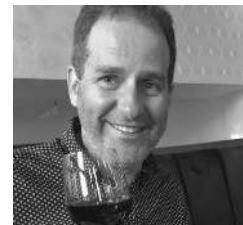
Par François Deslauriers

É tant au repos depuis six ans, la troupe de théâtre Montserrat allait-elle reprendre du service un jour? Allait-elle remonter sur les planches et retrouver ses fidèles spectateurs?