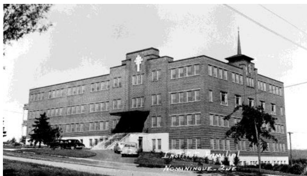
1951 - Institut familial.

L'enseignement change. Sur quatre ans, les 10 e et 11 e années sont l'équivalent du cours secondaire du département de l'Instruction publique. Les 12 e et 13 e années sont de niveau collégial et donnent le diplôme d'Éducation familiale.