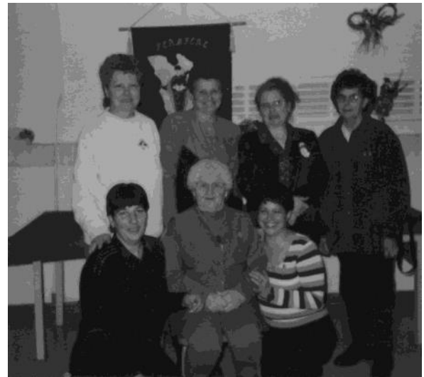
Cercle de Fermières Lac-des-Écorces, décembre 2000.

L'histoire du Cercle des Fermières de Lac-des-Écorces démontre une ferme volonté de ses membres de poursuivre leur mission en dépit des nombreux défis qui se sont dressés sur leur route. La majorité des Fermières d'aujourd'hui ne proviennent plus du milieu rural et continuent d'agir sur la conservation et la transmission du patrimoine artisanal et sur l'amélioration de la condition de vie de la femme et de la famille. Voilà la raison de relancer l'activité tissage au Cercle de Lac-des-Écorces qui n'existait plus. Eh oui, il y a toujours eu des Fermières à Lac-des-Écorces comme le pensaient les doyennes. Ça fait quatre-vingt-huit ans qu'elles sont là afin de transmettre le respect du patrimoine.