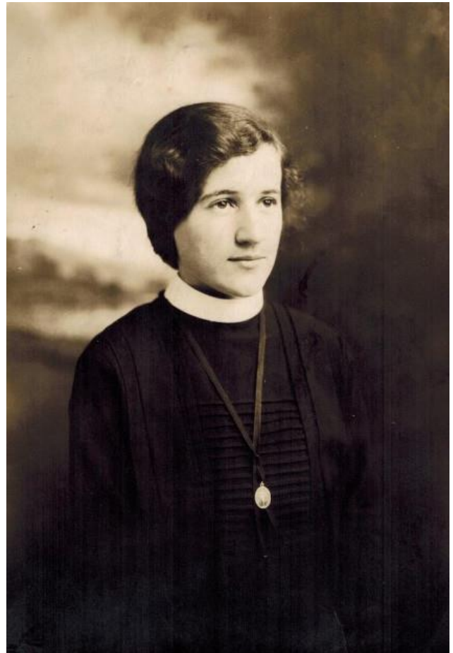
À l'école normale en 1932.