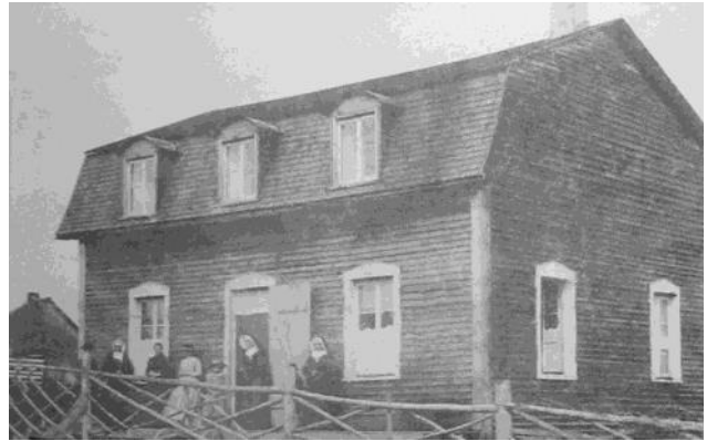
1887 - Première habitation des Sœurs de Ste-Croix et première école.