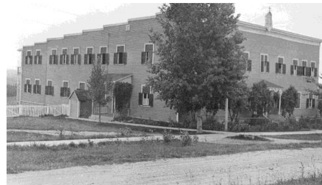
1900 - 1951 - Premier couvent qui devint l'École Ménagère Régionale.