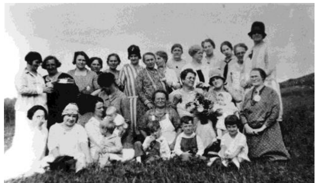
Pique-nique des Fermières 1924 ou 25.

Le rôle de la femme a bien changé à travers les époques et, bien que les textes aient pu en témoigner d'une façon éloquent, les photos, elles aussi, parlent de cette évolution, d'où l'importance de confier les documents historiques aux soins d'une société ayant les compétences pour les traiter adéquatement et pour les faire rayonner à leur juste valeur. En effet, l'histoire est une construction où chaque pierre de l'édifice compte.