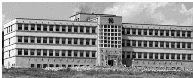
L'hôpital de Mont-Laurier en 1949.

Un autre aspect de soins retient son attention, la pénurie de personnel soignant spécialisé. Avec l'aide de consœurs, une école de gardes-malades auxiliaires est créée. Au fil des années, les différentes promotions ont permis de suppléer au manque d'infirmières licenciées en fournissant un personnel choisi, formé, compétent et capable d'apporter une aide de qualité au petit nombre d'infirmières licenciées en place.