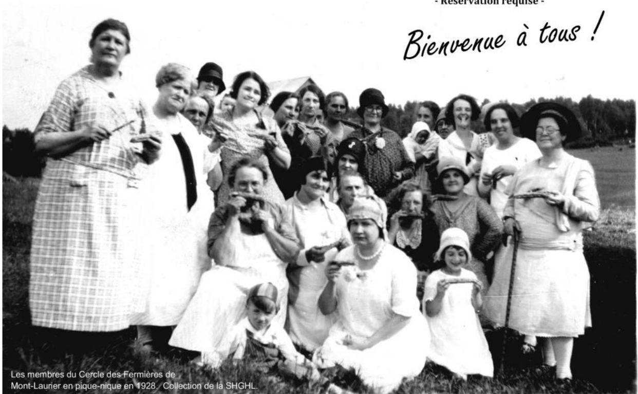
Les membres du Cercle des Fermières de Mont-Laurier en pique-nique en 1928.