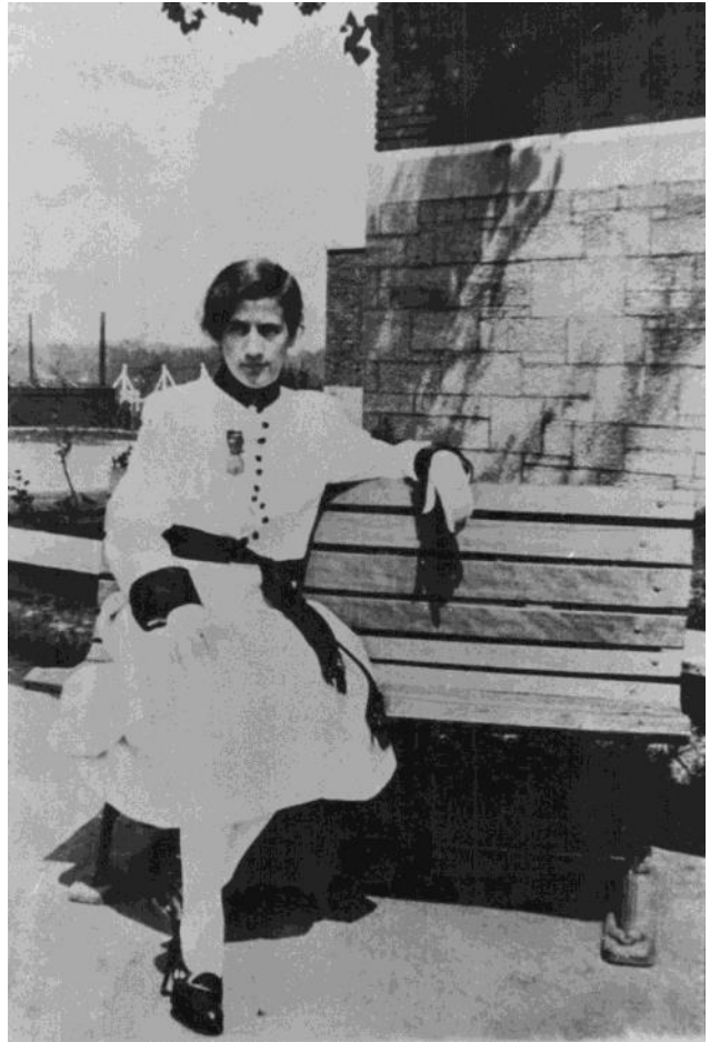
Lors de son interprétation de L'aiglon en juin 1932.

Pendant des années, elle fera encore du théâtre, cette fois à la salle paroissiale au coin des rues Chasles et Bellerive. Au début des années cinquante, cette salle est devenue le Centre des loisirs. Elle fait partie du comité qui doit l'administrer.